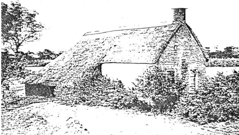
Kolonistenwoning te Wilhelminaoord

Iedere kolonist in de gewone koloniën mocht zijn huishouding zelf inrichten, maar moest wel de bepalingen van de koloniale rechten in acht nemen. Voor handhaving hiervan was een Raad van Toezicht ingesteld. Degene die zondigde tegen de reglementen als verwaarlozing van zijn middelen of schending van de