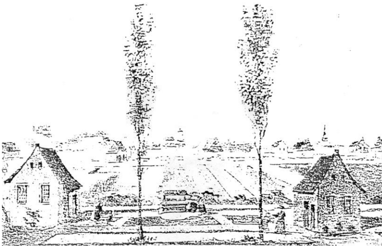
Gezicht op de kolonie Willemsoord

Een kolonist, die in de kolonie aankwam tekende een schuldbekentenis van fl 1.700,00. Deze schuld omvatte de bouw van zijn boerderijtje (zie schema 2. Schetsen van de boerderijtjes); de opmaak van de helft van de grond (3 ha; 40 are was afgescheiden voor privé-bebouwing), huisraad, gereedschappen, enkele schapen, een koe en kleding (ten dele geüniformeerd). Onder leiding van de sectiemeesters werd de grond ontgonnen en bebouwd. Op basis van verkoop van eenderde van de oogst kon de kolonist levenslange vruchtgebruik verwerven. Kleding, huisraad e.d. werd na afbetaling eigendom. Doel was dat de kolonist uiteindelijk zelfstandig moest kunnen functioneren (z.g. "vrijboer"). Door medailles van hogere kwaliteit te verwerven groeide men door tot "vrijboer".